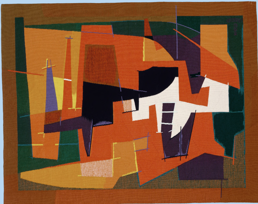
Masser af farver i "Ervan" (Deyrolle, 1952)