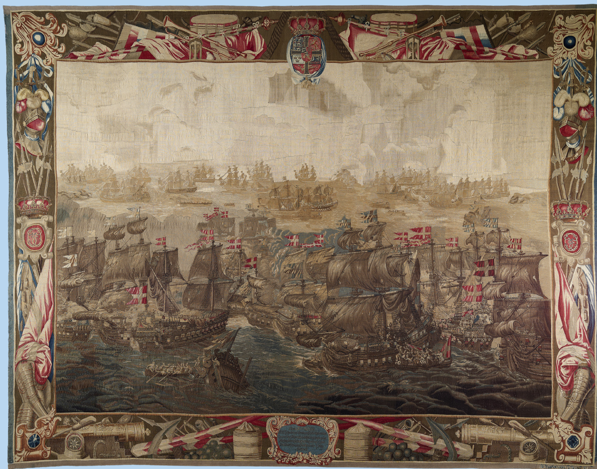
Slaget i Køge Bugt (van der Eichen, 1685-93).