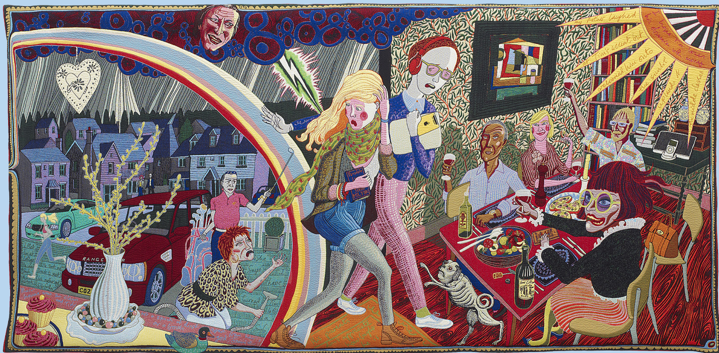
Expulsion from Number 8 Eden Close (Grayson Perry, 2012).