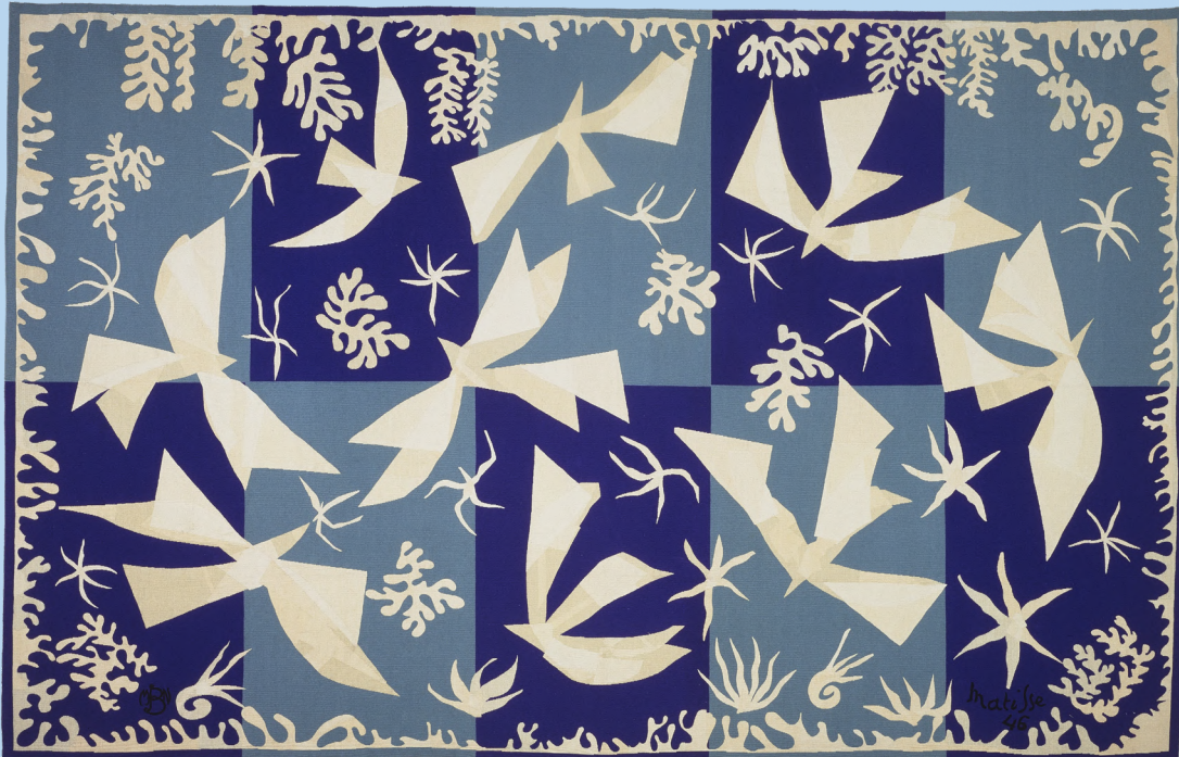
"Himlen" (Matisse, 1950-51)

Former og farver der ikke forestiller noget bestemt.