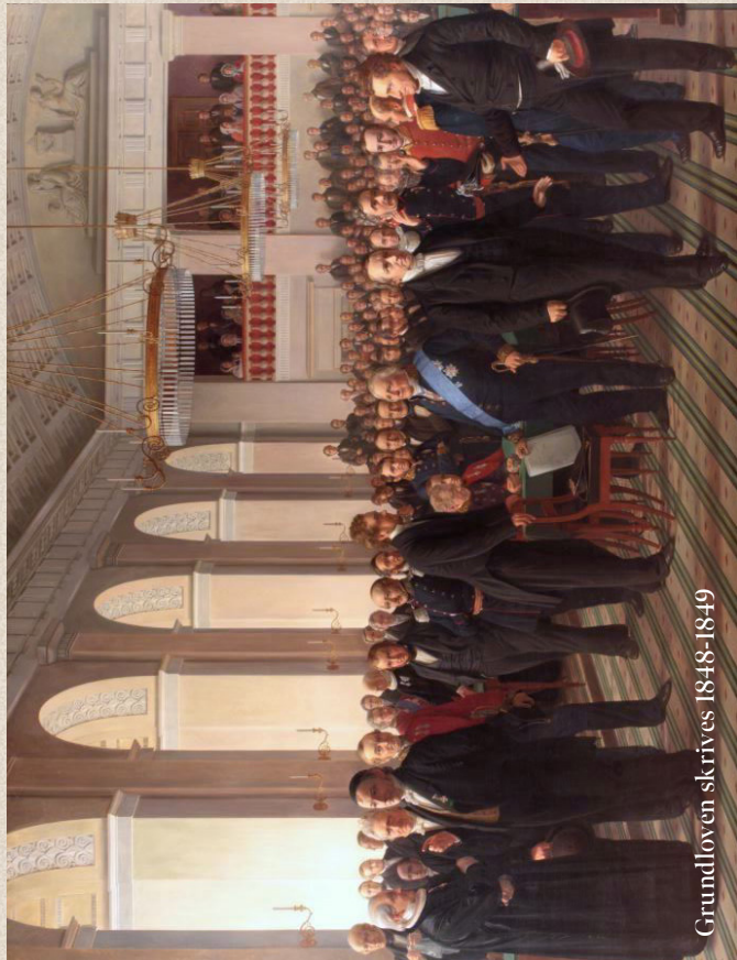
Grundloven skrives 1848-1849