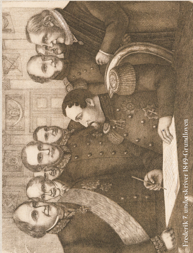
Frederik 7. underskriver 1849-Grundloven