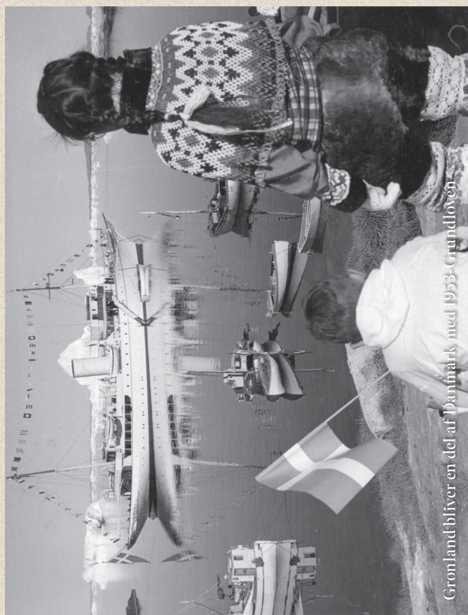
Gronland bliver en del af Danmark med 1953-Grundloven