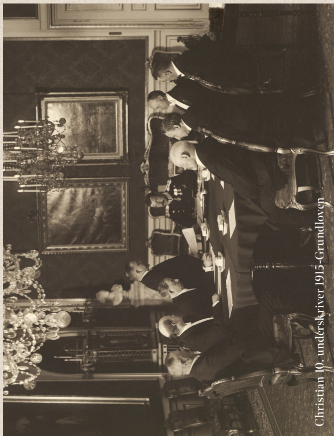
Christian 10. underskriver 1915-Grundloven