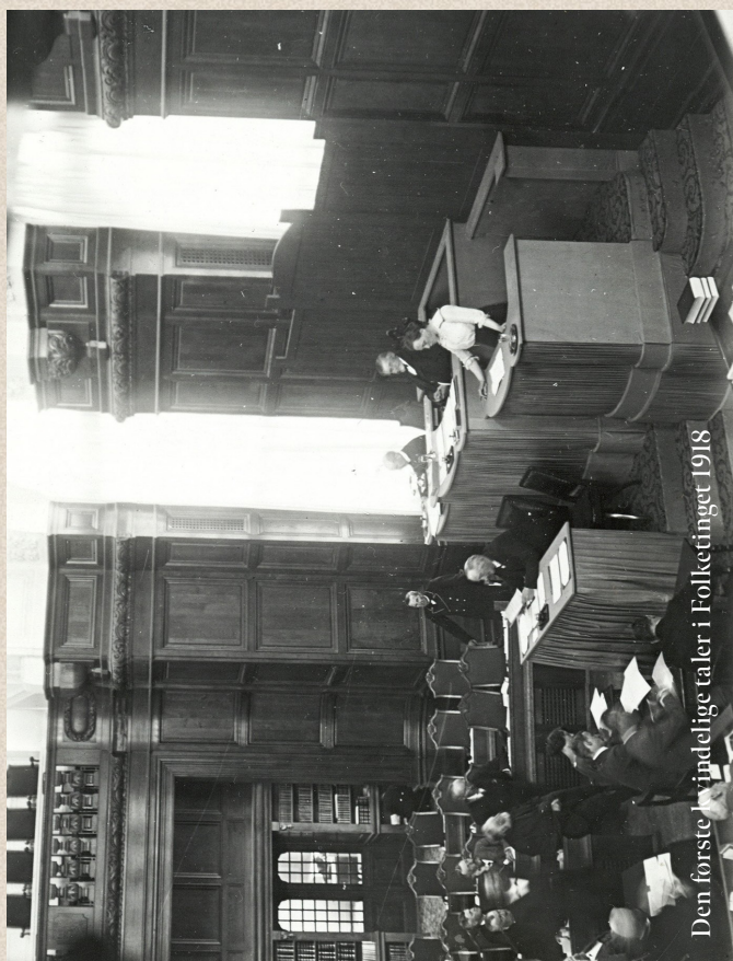
Den første kvindelige taler i Folketinget 1918