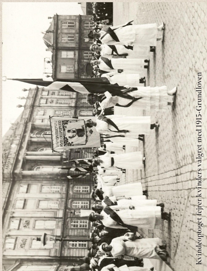
Kvindeoptøget fejrer kvinders valget med 1915-Grundloven