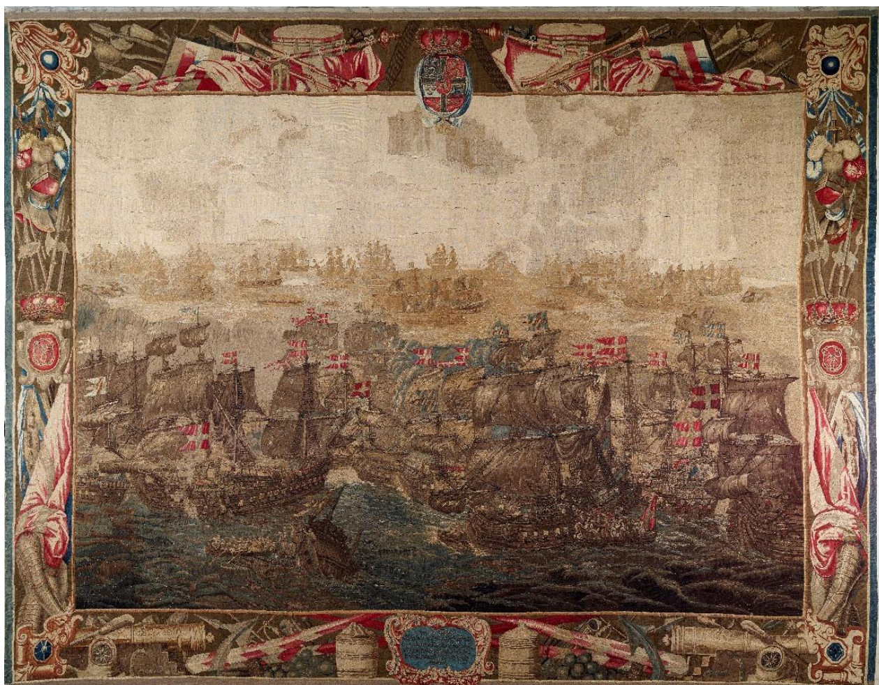
Slaget i Køge Bugt (van der Eichen, 1685-93).