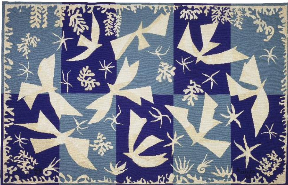
"Himlen" (Matisse, 1950-51)

Former og farver der ikke forestiller noget bestemt.