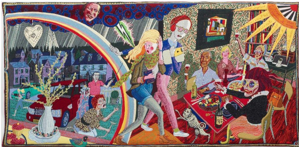
Expulsion from Number 8 Eden Close (Grayson Perry, 2012).

Hvordan kan kontraster hjælpe os med at få øje på noget vigtigt i et kunstværk?