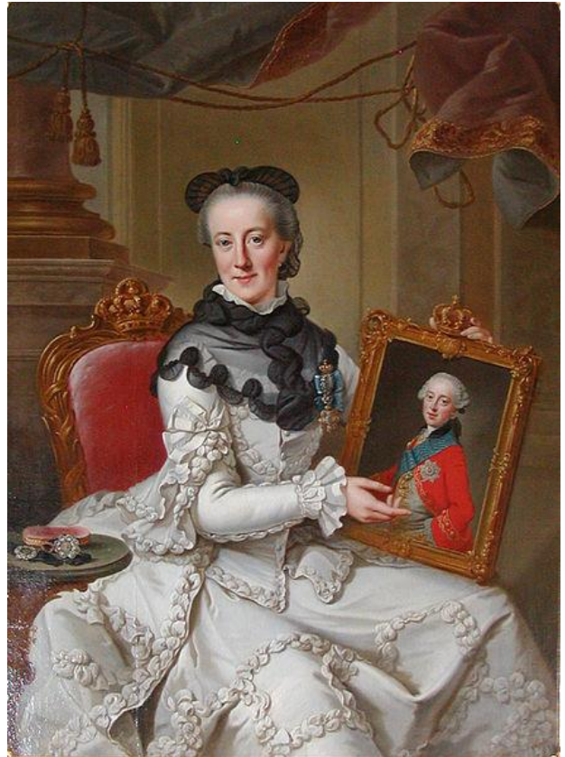
Juliane Marie med et maleri af Arveprinsen.

Juliane Marie og Arveprinsen blev ved hoffet, selvom de to dele af familien havde det svært med hinanden.