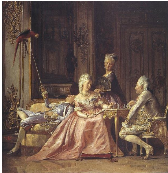
Christian 7., Caroline Mathilde og Struensee med hofdame.